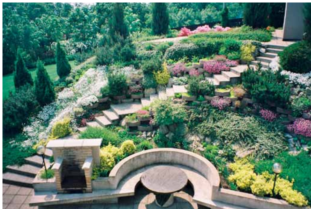
Súkromné záhrady, 1997 - 2002